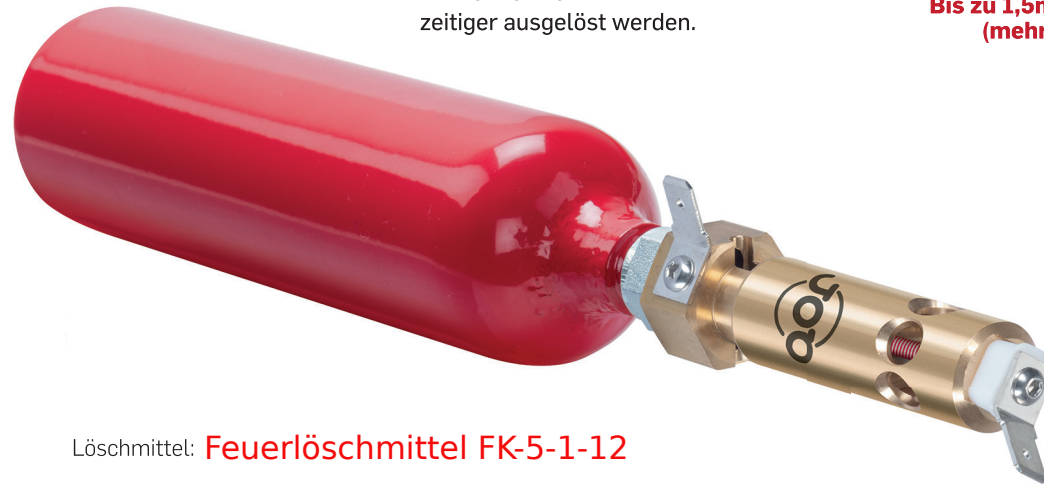
Löschmittel: Feuerlöschmittel FK-5-1-12

Durch den Anschluss an z.B. einen Rauchwarnmelder kann der Löschvorgang sogar noch früh zeitiger ausgelöst werden.